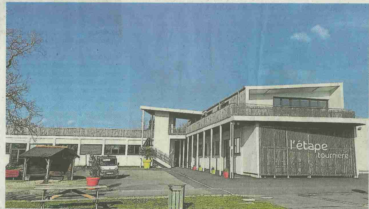
L'Esat L'Étape Tournière accompagne 107 travailleurs en situation de handicap, avec le soutien de trente encadrants.